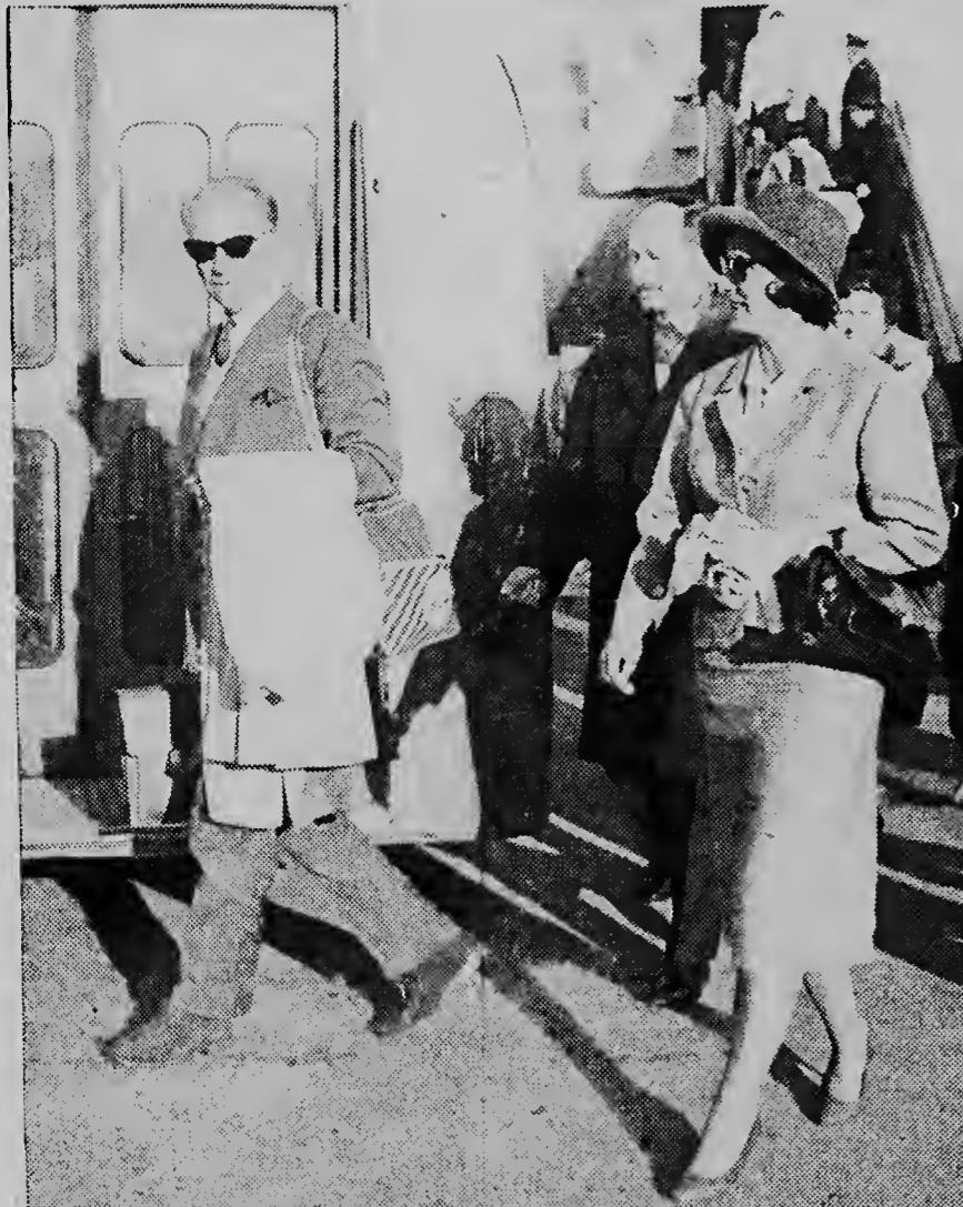
REY LEOPOLD I PRINCESA LILIANE NA SCHIPHOL. — Rey Leopold i princesa Liliane de Rethy, quendenan a bai haci un bishita na New York i cu a caba di cumpli cu un mission economico na Sur America, a pasa corto tempo na Schiphol cu destino pa Brussel.

Bestek en tekeningen zijn vanaf heden verkrijgbaar a f 10.— per stel bij bovengenoemde dienst. Restitutie uitsluitend op de dag van aanbesteding voor ongeschonden exemplaren f 7.50 per stel.